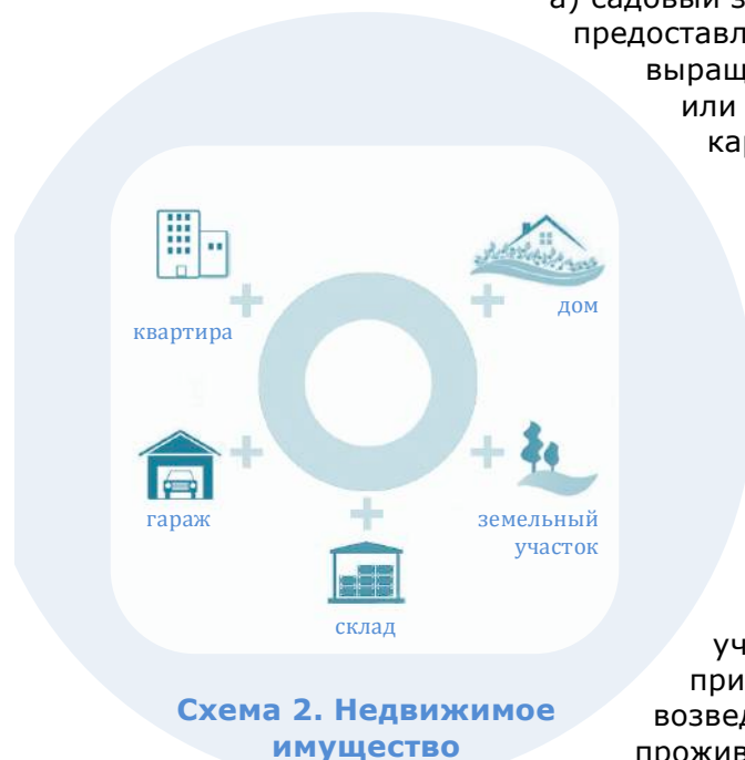
Схема 2. Недвижимое имущество